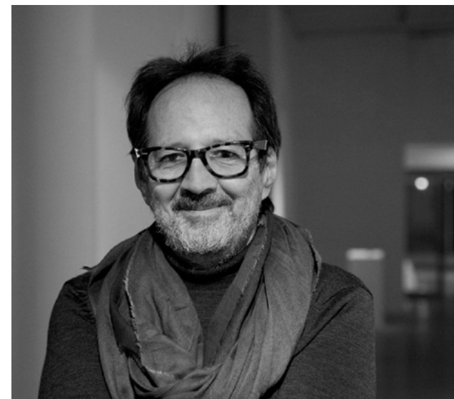
Oscar Muñoz 1951, Popayán, Colombia Vive y trabaja en Cali, Colombia

Entre las sombras y borraduras de cada impresión podemos identificar vagamente a dos personajes decisivos para la historia de Colombia, Jorge Eliécer Gaitán y Laureano Gómez, quienes fueron los principales actores de la confrontación política entre liberales y conservadores (respectivamente) que marcó hacia la década de 1940 lo que los historiadores han denominado como el inicio de la época de la Violencia - con mayúscula- en el país suramericano. Muñoz nos posiciona ante uno de los momentos históricos fundamentales para comprender la historia de su país, nos posiciona desde su campo visual generando un puente entre el espectador y él mismo a través de la mano. Nos enfrenta a un texto difuso e incierto, generando entre las páginas una vorágine vertiginosa de ecos visuales que se disputan entre la posibilidad y la imposibilidad de leer, re-leer, entender y finalmente pasar estas páginas de la historia de su país.