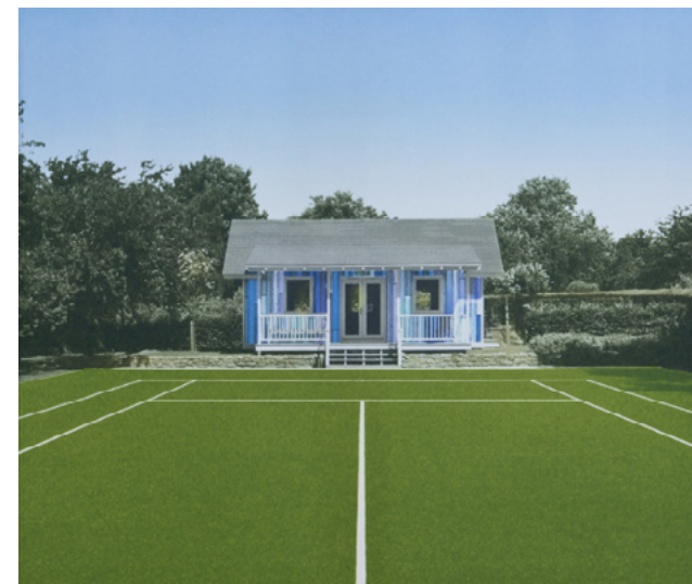
Blue House Painting III

Las reproducciones son sólo de referencia. Los colores pueden no corresponder con los de los originales | Please note that the reproductions are for reference purposes only. Colours may vary in comparison to the originals