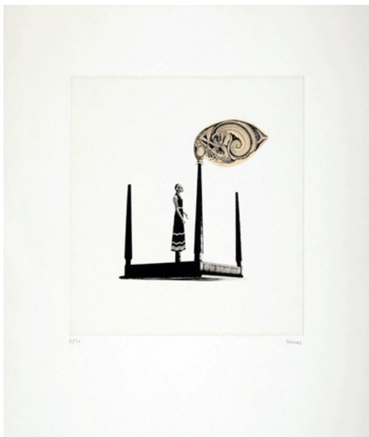
Dream Kitchen (Breakfast)