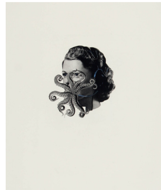
Dream Kitchen (Lunch)

Las reproducciones son sólo de referencia. Los colores pueden no corresponder con los de los originales | Please note that the reproductions are for reference purposes only. Colours may vary in comparison to the originals