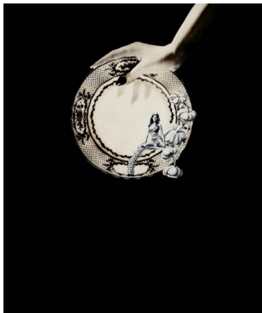
Dream Kitchen (Dinner)